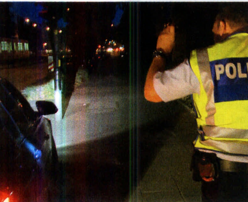
Polizeikontrolle in Köln

Im vergangenen Jahr sind bei Verkehrsunfällen auf Deutschlands Straßen 3475 Menschen getötet worden, fast 100 mehr als 2014. Die