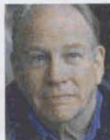
F. William Engdahl: »Die Manipulation der öffentlichen Meinung durch angloamerikanische Denkfabriken«