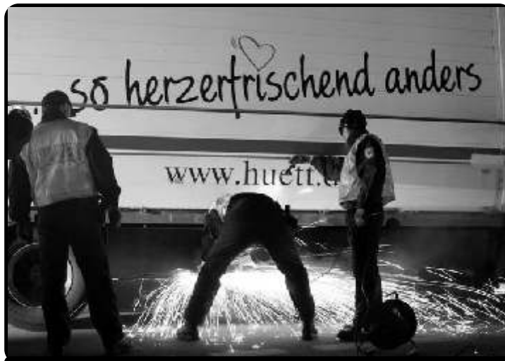
Greenpeace: Coole Blockade beim Castor. So herzerfrischend anders sind ihre Diskurse aber nicht.

Sowohl den diskursiven Anstrengungen der bürgerlichen Medien und Parteien, wie auch den antideutsch-postlinken Strömungen muss die Idee eines emanzipatorischen Umweltschutzes entgegengestellt werden. Welcher bedeutet, dass