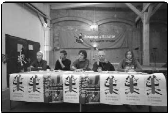
Sprechen gern für andere: Nicht nur auf dem Klimacamp oder in Kopenhagen

fähig welcher Bahnhof sei und so weiter. Gewarnt wird vor weiteren direkten Aktionen, da diese die Gespräche in Gefahr stellen könnten. Auch wenn im Widerstand gegen die Atomkraft etwas mehr Reflektion über eine Kooperation mit der herrschenden Politik vorhanden sein mag, ist es hier das gleiche Bild. Die komplette Bewegung