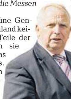
Agrarminister Till Backhaus (SPD)

OZ: Das Agrobiotechnikum Groß Lüsewitz im Landkreis Rostock befasste sich bis 2011 mit Gentechnik-Versuchen. Sind die Messen endgültig gesungen? Backhaus: Ja, die grüne Gentechnik hat in Deutschland keine Zukunft. Große Teile der Bevölkerung lehnen sie ab. Für mich war das ein Lernprozess. Wenn ein Konzern wie die BASF bei Versuchen mit genveränderten Kartoffeln im alten Müritzkreis so schwerwiegende Fehler macht, dann kann ich das vor den Menschen nicht mehr verteidigen.