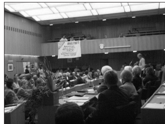
Abb. oben: Foto aus der Stadtverordnetenversammlung. Ein Transparent hängt friedlich von der Tribüne, während der PDS-Abgeordnete zunächst weiter seine Rede hält. Wenige Zeit später löst allein das einen beachtlichen Polizeieinsatz aus – ein Zeichen für die Nervosität in der Gießener Elite.