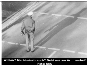
Willkür? Machtmissbrauch? Geht uns am Ar ... vorbei!

E ine Verkehrskontrolle läuft im Allgemeinen nach festen Regeln ab: Blaulicht an, „Guten Abend, Verkehrskontrolle, Papiere bitte“ und im Normalfall folgt ein „Gute Weiterfahrt“. Scheint fast so, dass dem