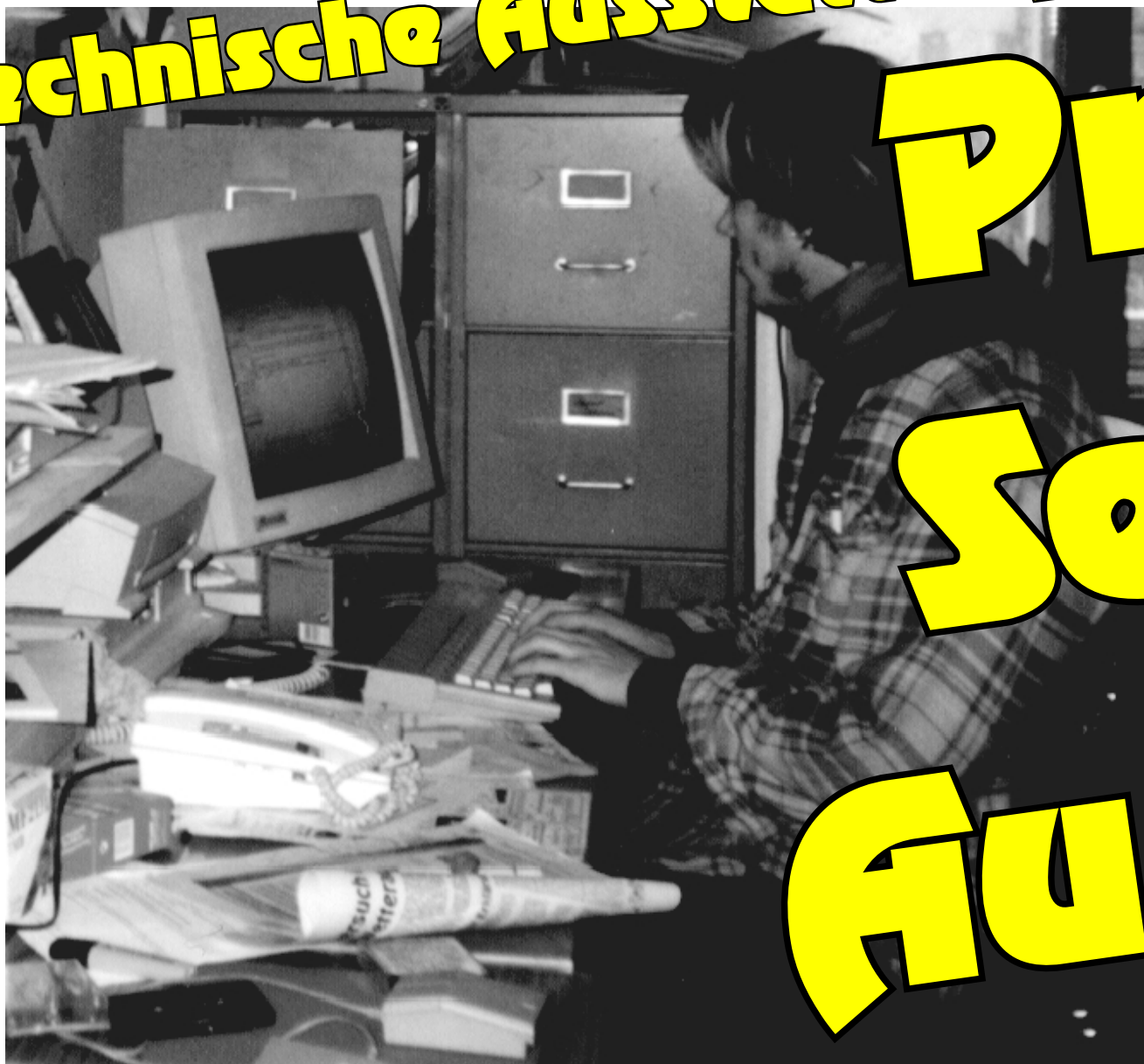
Blick ins Innere IV: Computer (für Layout, Internet, Grafik- und Textbearbeitung usw.), Layoutarchive, Fotolabor, Kopierer usw. – nutzbar auch für alle Gruppen.