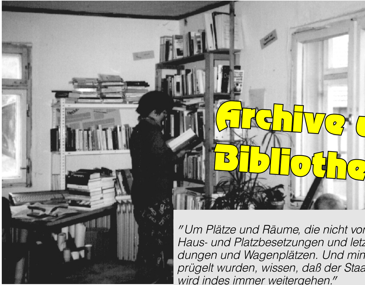
Blick ins Innere I: Ca. 10.000 Bücher und viele Unterlagen – ein riesiges Bewegungsarchiv in mehreren Räumen verteilt!