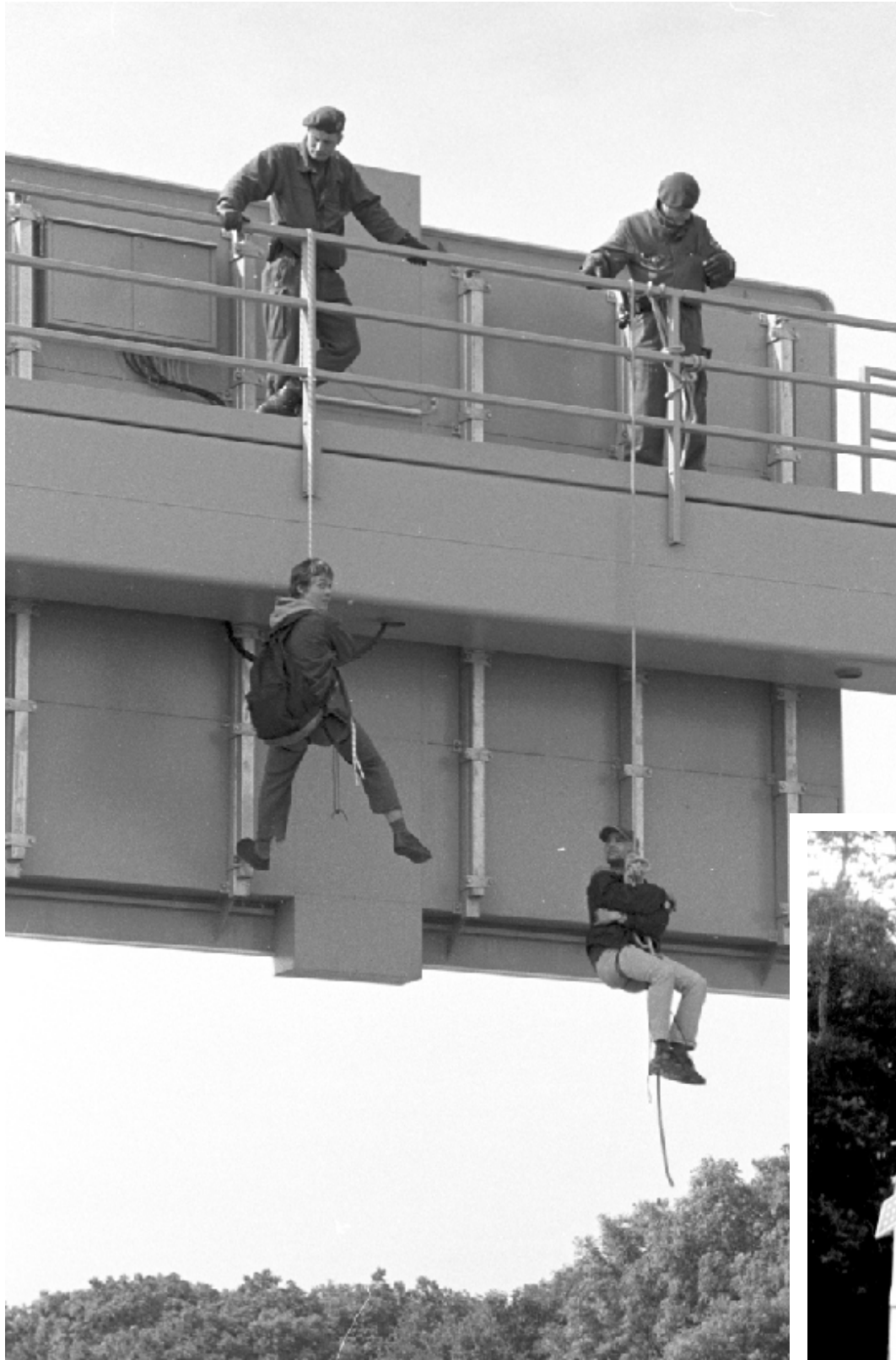
Wenn ... dann richtig: Zusammen mit Aktionsgruppen aus anderen Städten legten wir am 1.6.2000 den Messeschnellweg für 90min lahm – nur wenige Meter vom Expogelände entfernt. Hätte die Expo stattgefunden (leider kamen kaum BesucherInnen), wäre ein Verkehrschaos unvermeidlich gewesen.