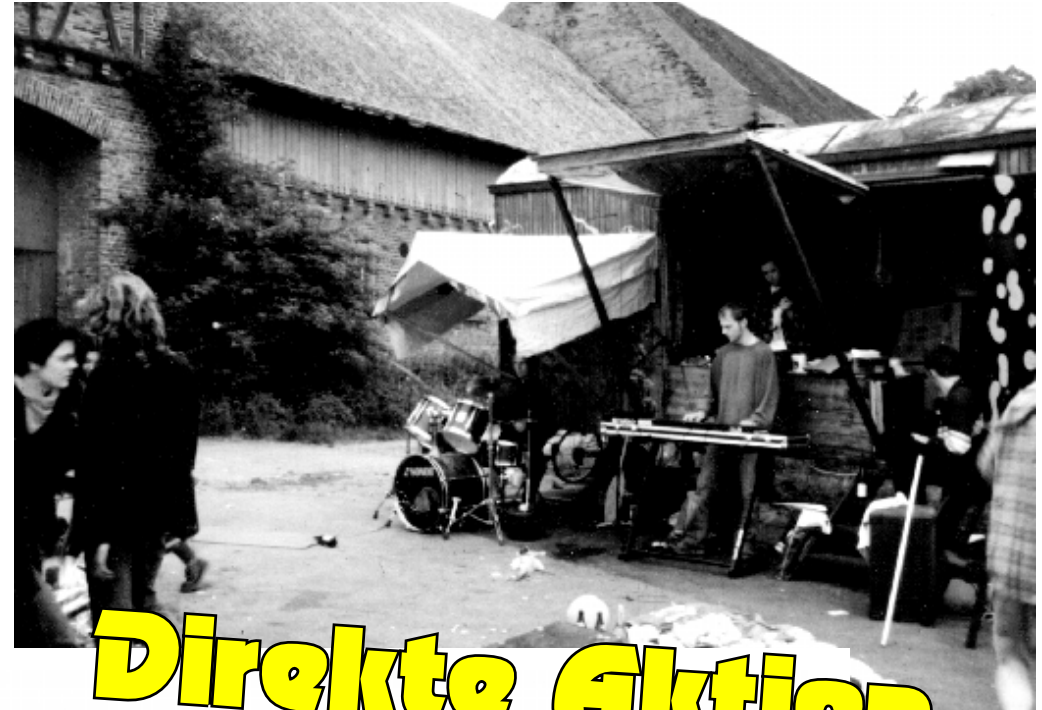
Erfolglos, aber hart umkämpft: Golfplatzbau in Winnerod – Aktionen in Parlamenten, Blockaden, Golfplatzbesetzungen (mit Bandauftritt am Aktionsmobil, siehe Foto), viele Öffentlichkeitsarbeit und eine Alternativplanung für einen Ökohof!