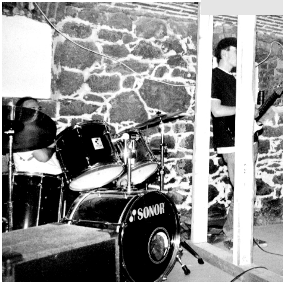
Blick ins Innere II: Schallsisolierter Feten- und Proberaum.

Innere III: Seminarraum mit Projektoren und mehr – zusätzlich gibt es noch Räume für Kleingruppen.