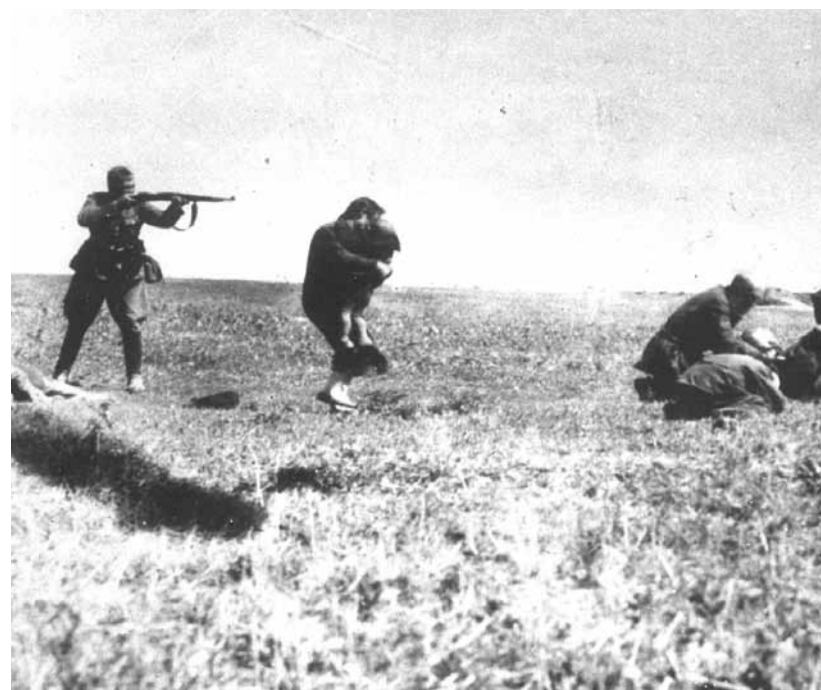
Viele Mordaktionen bleiben ungesühnt: Erschießung von Juden durch SS-Eingreiftruppen.