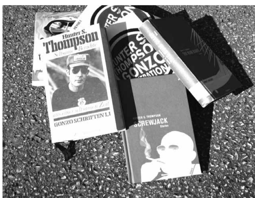
Thompson hat einen Haufen Bücher geschrieben – die meisten sind auch auf deutsch erhältlich.

Der Freistaat Puerto Rico in den 50er Jahren: Paul Kemp, ein amerikanischer Journalist mit ausgeprägter Trinksucht, beginnt seinen Job bei der einzigen amerikanischen Zeitung im spanischsprachigen Außenbezirk der USA. Die ebenfalls trunksüchtigen Redaktionsmitglieder des San Juan Star leiden unter sinkender Auflage und sind nur daran interessiert, keine Anzeigenkunden zu verlieren. Amerikanische Investoren planen krude Deals und große Hotelbauten, die das beschauliche Inselparadies nachhaltig zerstören könnten. Die PuertoricanerInnen beäugen die Gringos skeptisch. Der Reporter Kemp wird angeworben, die Öffentlichkeitsarbeit für ein ausbeuterisches Hotelprojekt zu übernehmen. Kurz ist er vom Geld verführt, besinnt sich im Laufe des Films aber eines Besseren. Er verliebt