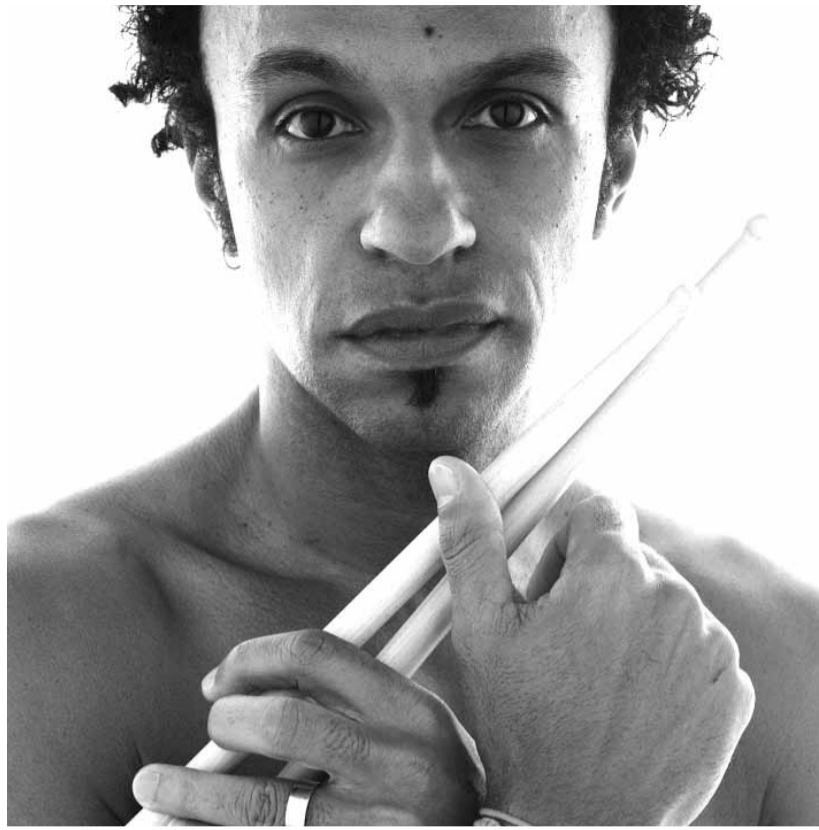
Das Internationale Jazzfestival Dortmund steht für zeitgenössischen europäischen Jazz. Manu Katché vertritt dabei Frankreich.

Vom 26. Oktober bis zum 24. November wird es eingefleischte Musikfreunde zu den Internationalen Jazztagen nach Dortmund ziehen. Neben Locations wie dem domicil, das als Homeoffice und Wohnzimmer des Ruhrgebietsjazz gilt, sind auch andere Dortmunder Veranstaltungsorte beteiligt. „Hier tritt insbesondere die junge, innovative europäische Jazz-Szene auf und bietet richtungsweisenden, grenzüberschreitenden Projekten ein Forum fernab des Mainstreams“, heißt es in der Ankündigung. Das bedeutet zum Beispiel: Fusion