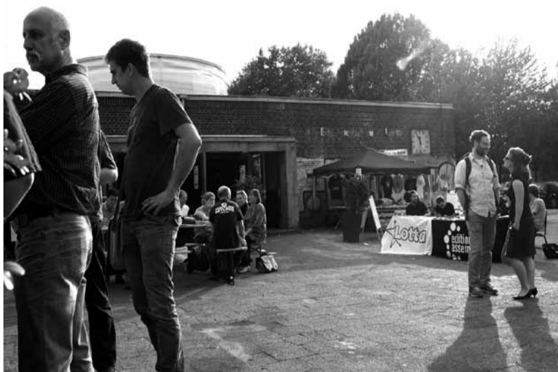
In Bochum geht was: Die einjährige Pause der Libertären Medienmesse füllte 2011 das Alternative Medienfestival.

(Chs) Sie sind unzufrieden mit kommerziellen Mainstreammedien und Schönwetterkultur à la Kulturhauptstadt Ruhr 2010: Deswegen gründete eine Gruppe von Medien-, Sozial- und GewerkschaftsaktivistInnen aus dem Ruhrgebiet, dem Rheinland und dem Niederrhein die Libertäre Medienmesse (Limesse). Nach einem Jahr Pause macht die zweite Ausgabe der Limesse nun vom 24. bis zum 26. August Halt im Bahnhof Langendreer in Bochum.