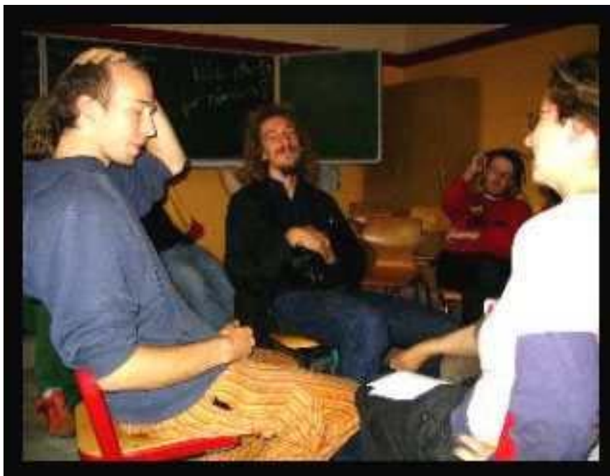
Zwei Bilder von einer Fish Bowl. Unten: Überall hingen Erklärungs-Blasen.