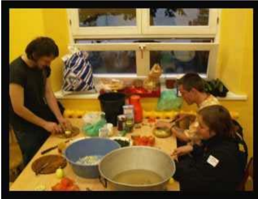
Selbstorganisiertes Essen, meist ausreichend für viele Menschen