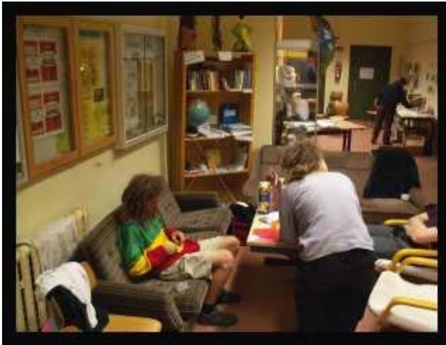
Workshop- und Rückzugsecken im Offenen Raum