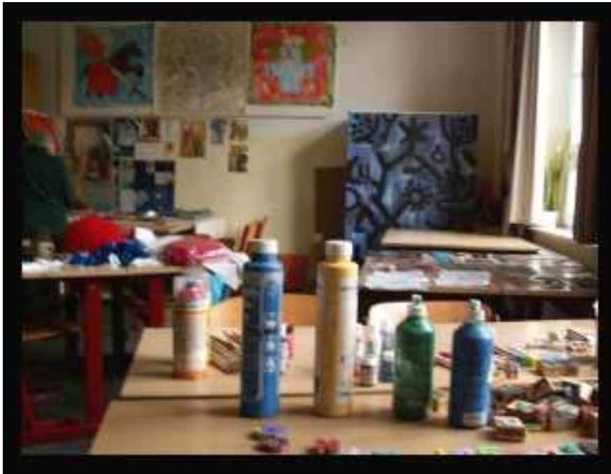
Kreativ-Plattform im Offenen Raum