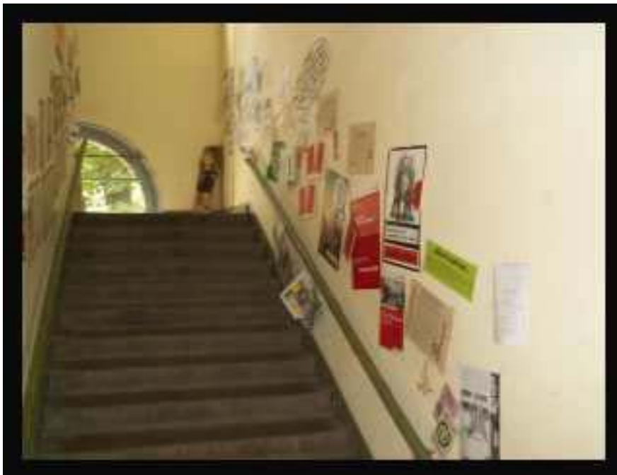
Eine von mehreren Ausstellungen in den Gängen