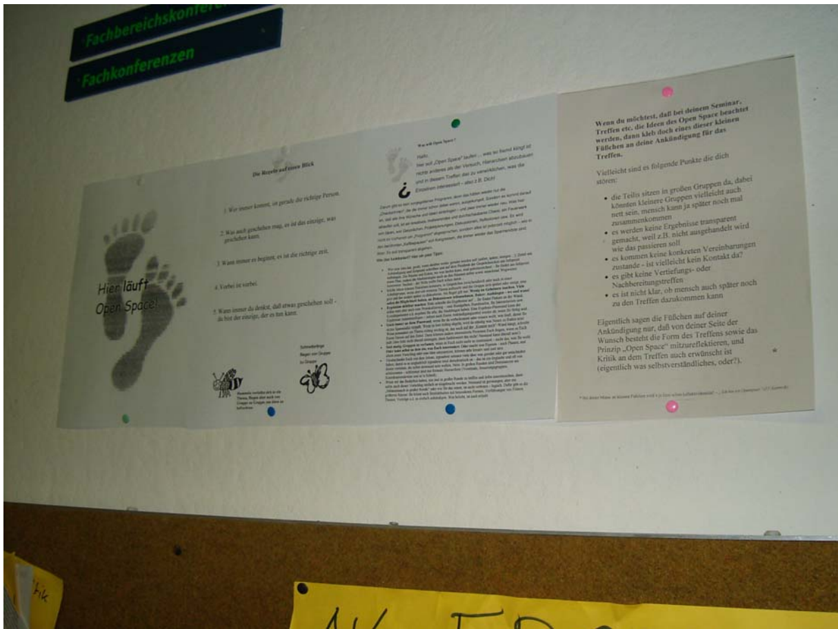
Open Space – Anleitungswand