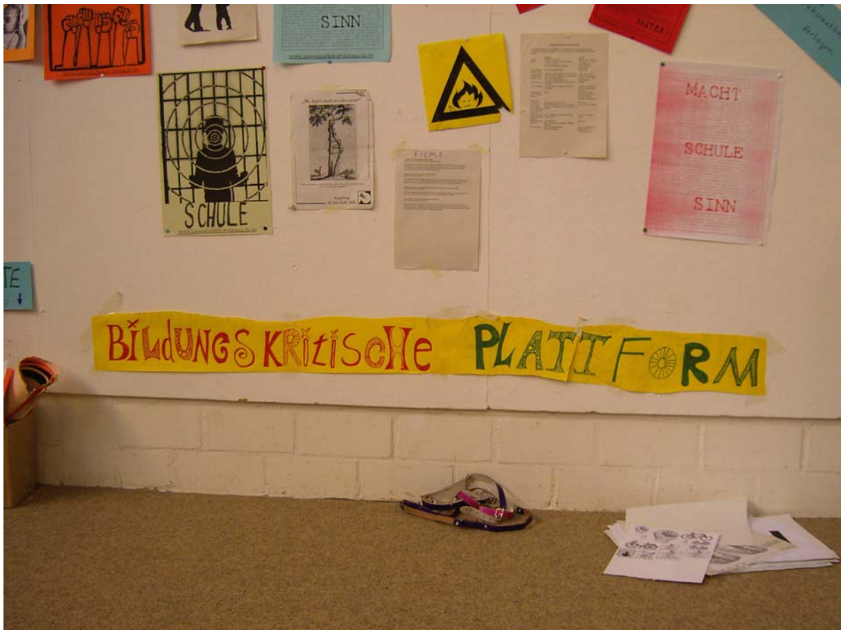
Offene Plattform zu Bildungskritik