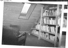
Kleingruppenräume und -ecken in der Bibliothek