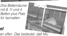
Drei Bettenräume mit 8, 11 und 4 Betten plus Platz für Isomatten