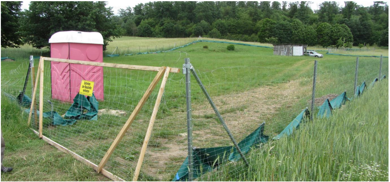
Aufnahme vom 4.6.2026: Zerstörte Reptilienzäune am Bauwerk 3