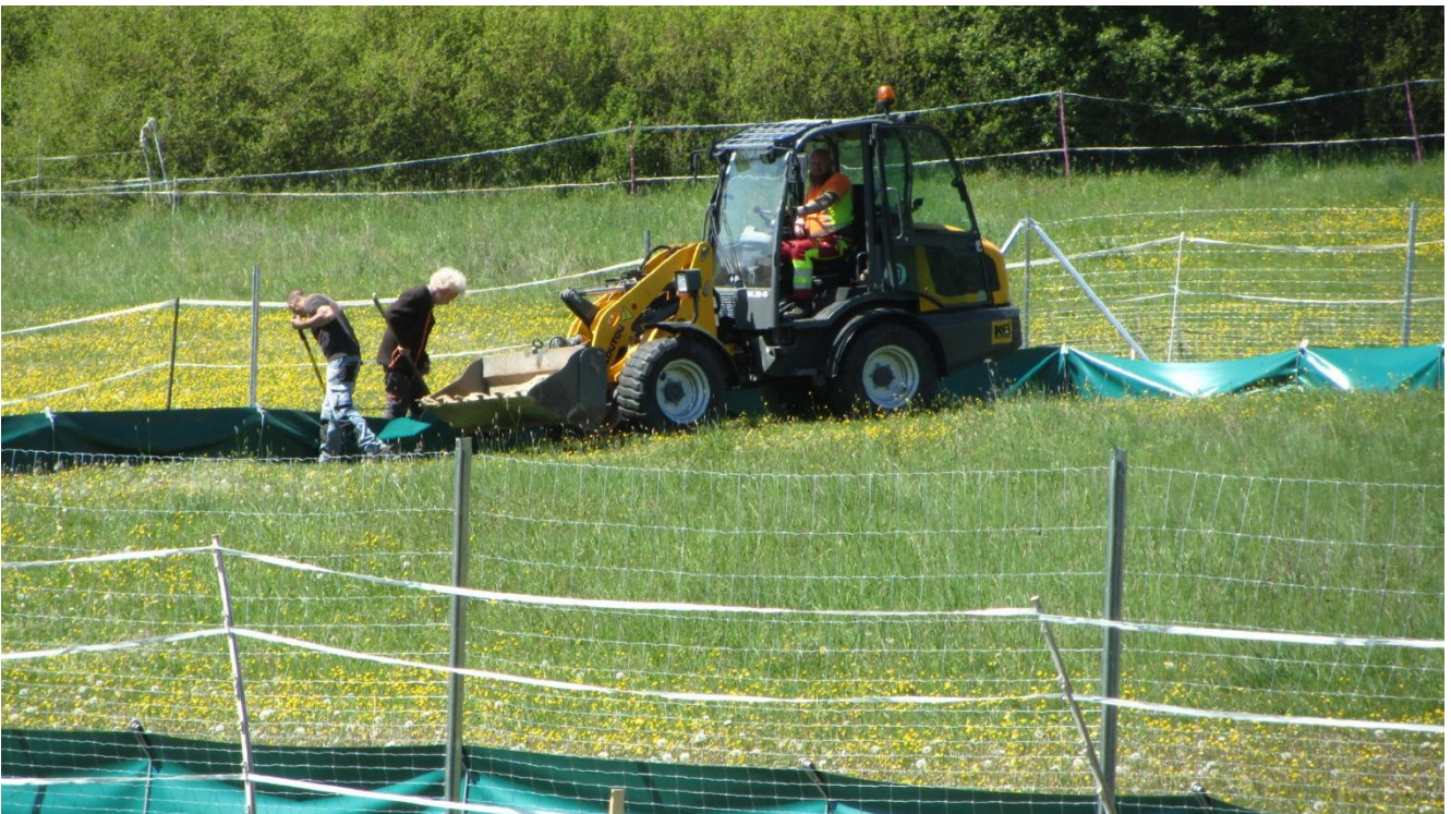
Wiedererrichtung des Reptilienschutzzaunes am 29.4.2026, später Nachmittag.