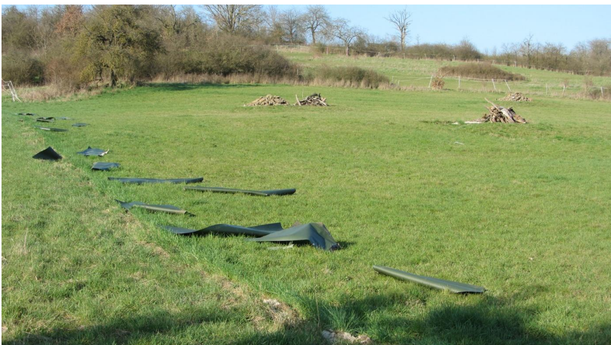
Aufnahmen vom 18.3.2026: Oben bei Bauwerk 4, mitte Bauwerk 3, unten das Ersatzbiotop.