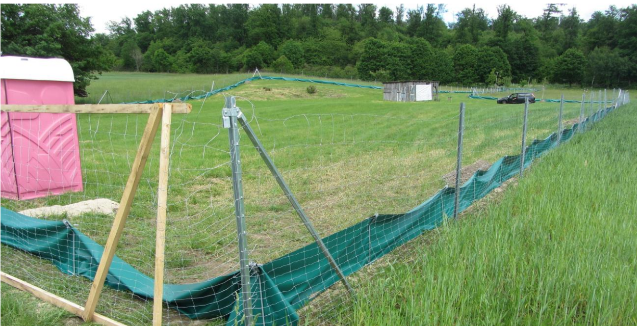
Zustand am 25.5.2026 (deutlich nach Mitte Mai): Neu errichteter Reptilienzaun, aber noch ohne Sandanhäufelung, daher für Zauneidechsen durchlässig (Folie mit Lücke über dem Boden).