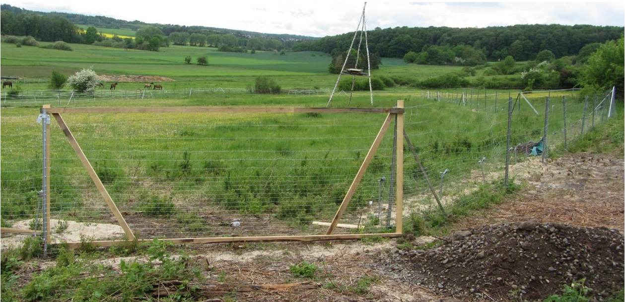
Zustand am 7.5.2026: Metallzaun wieder errichtet, aber noch kein Reptilienschutzzaun (Bauwerk 4)