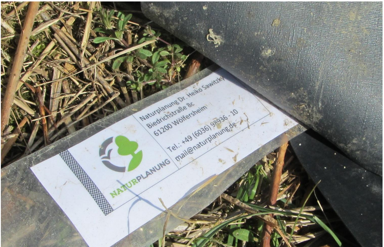
Aufnahmen vom 11.4.2026