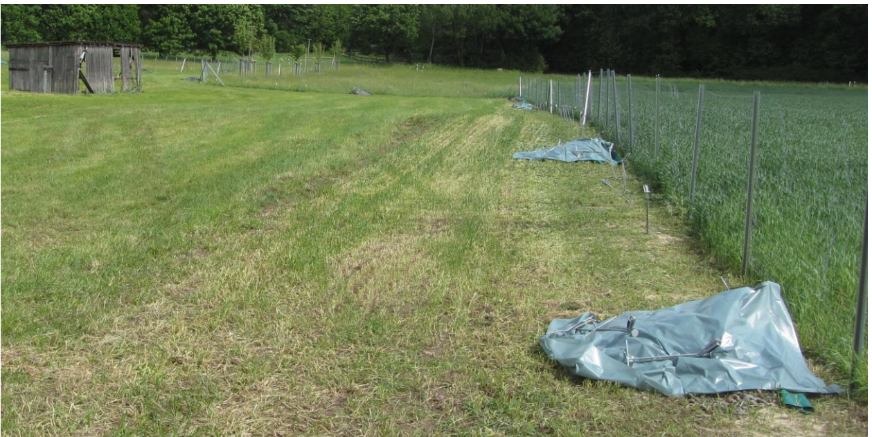
Zustand am 14.5.2026: Weiterhin kein Reptilienzaun (Bauwerk 3)