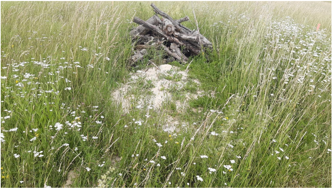
Aufnahme am 9.6.2026