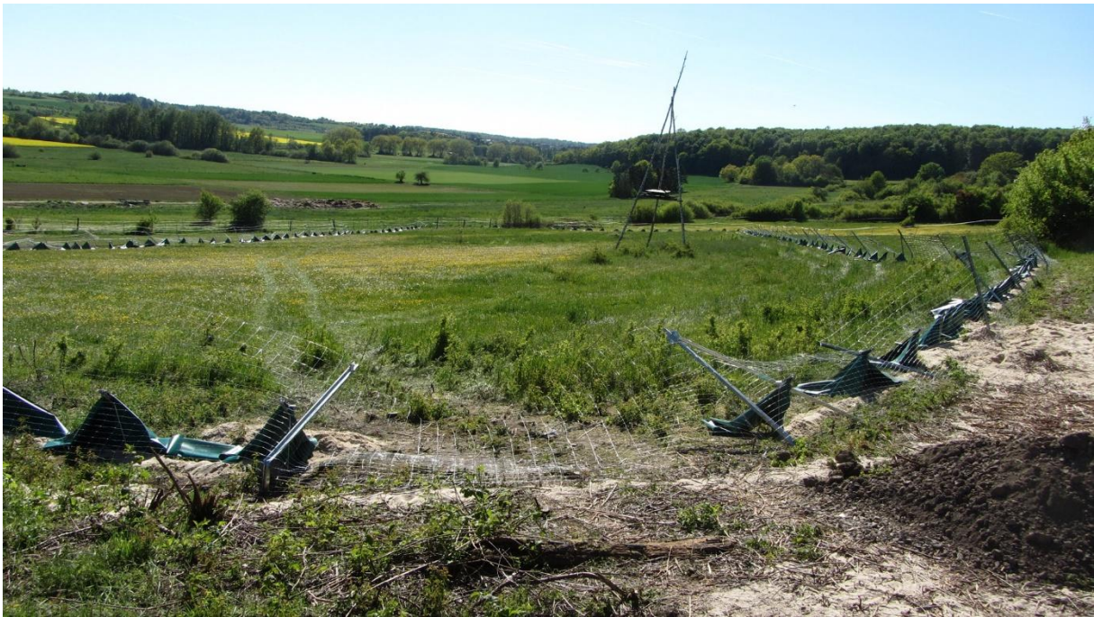
Aufnahme am 30.4.2026, einen Tag nach der (Wieder-)Errichtung: Metall- und Reptilienzaun zerstört – oben am Bauwerk 4, Foto unten am Bauwerk 3