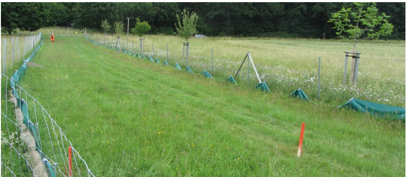
Aufnahme vom 15.6.2026: Zerstörte Reptilienzäune am Bauwerk 3