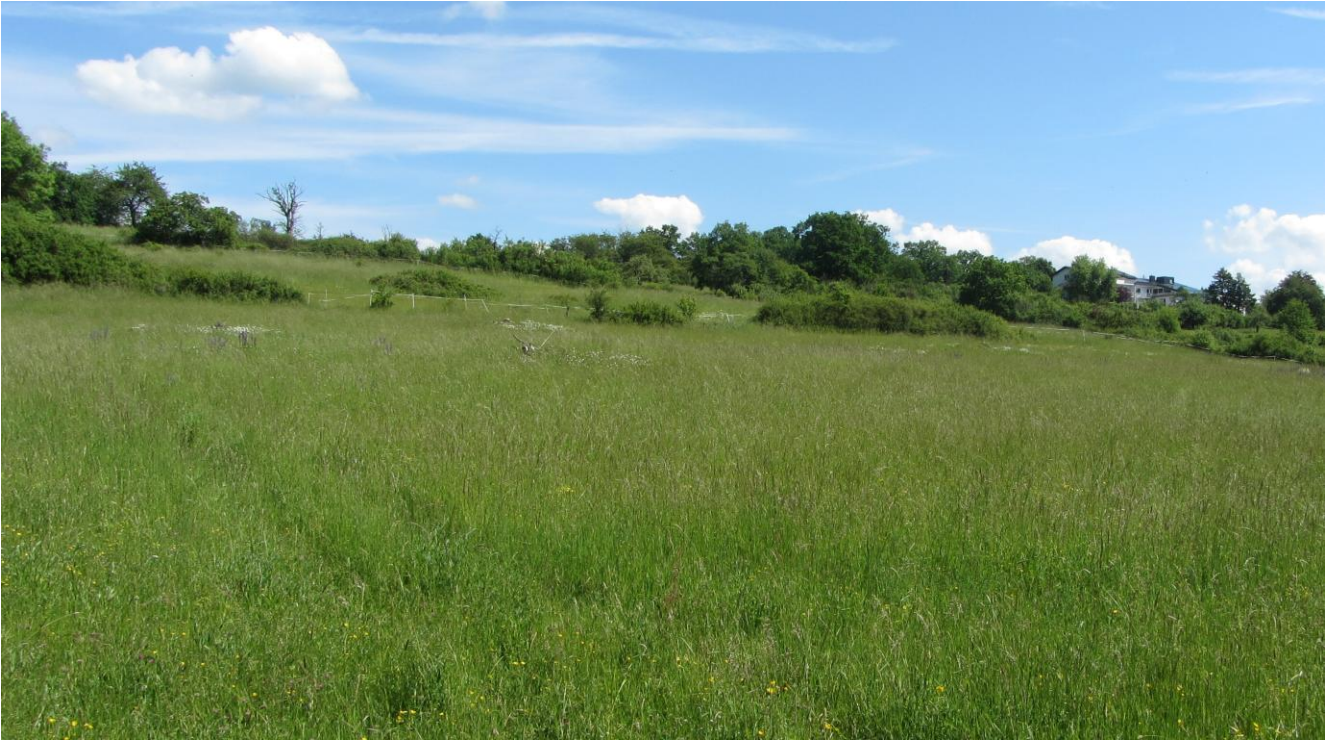
Aufnahme am 19.5.2026