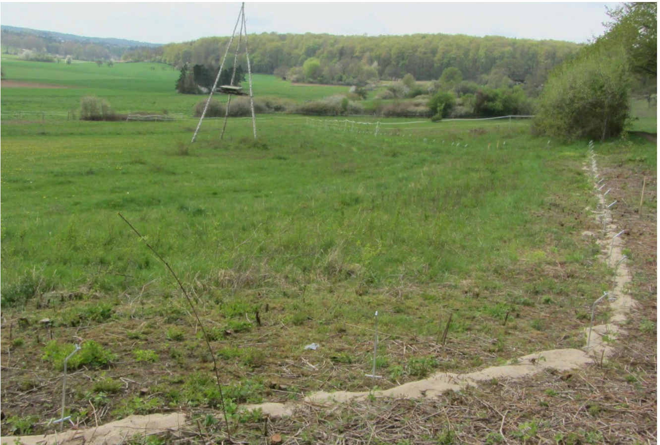
Zustand am 16.4.2026: Zerstörter Zaun entfernt, kein neuer errichtet.