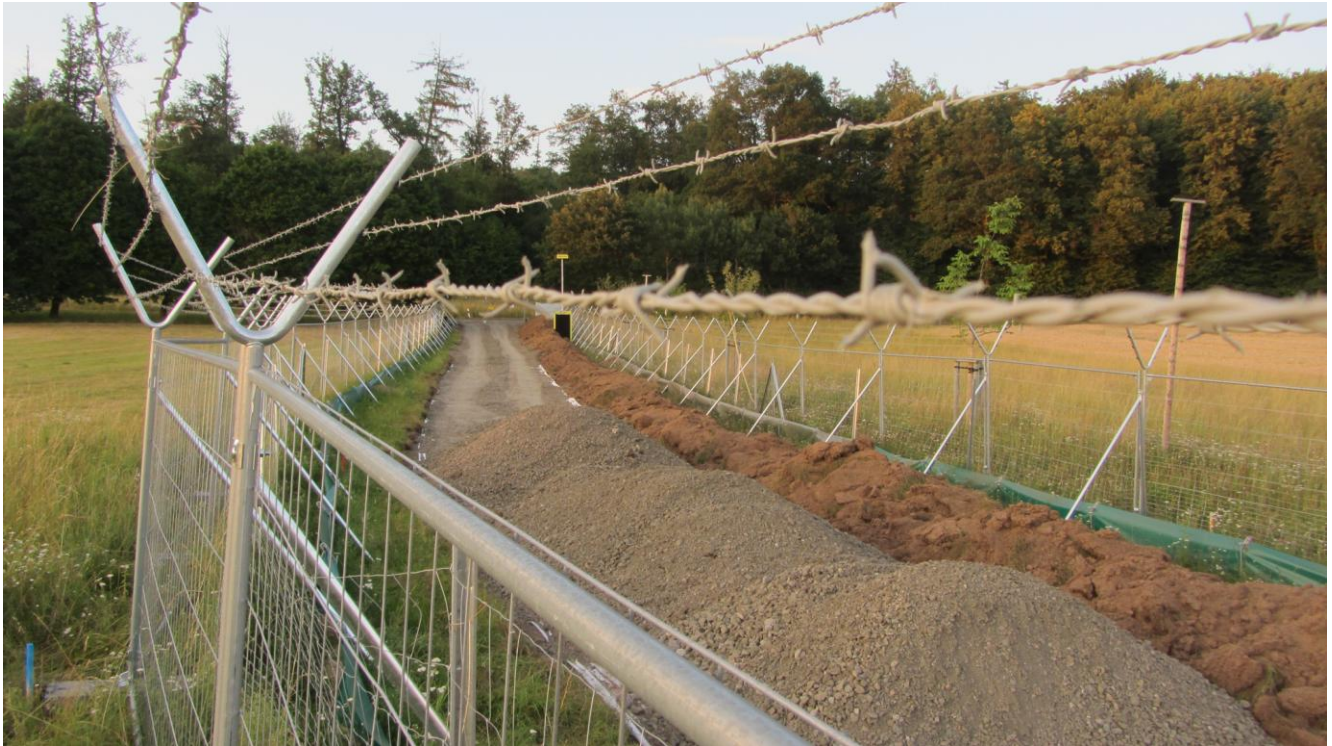
Fotos der Zerstörung am 29.6.2026 am Brückenbauwerk 3

Das angelegte Zielbiotop ist grundsätzlich ungeeignet (siehe unten). Es ist aber in jedem Fall nicht in einem Zustand, der für eine Umsiedlung von Zauneidechsen geeignet ist. Es gab bislang auch keine Umsiedlungsaktivitäten. Die Baustellen wurden ständig beobachtet. Beides, fehlendes Ersatzbiotop und keine Umsiedlungstätigkeiten, belegen, dass die Umsiedlung noch nicht stattgefunden hat. Trotzdem hat der Bau begonnen. Der Abtrag des Oberbodens auf der Baustelle zum Brückenbauwerk 3 stellt eine vollständige Vernichtung der dortigen Lebensstätten geschützter Arten dar.