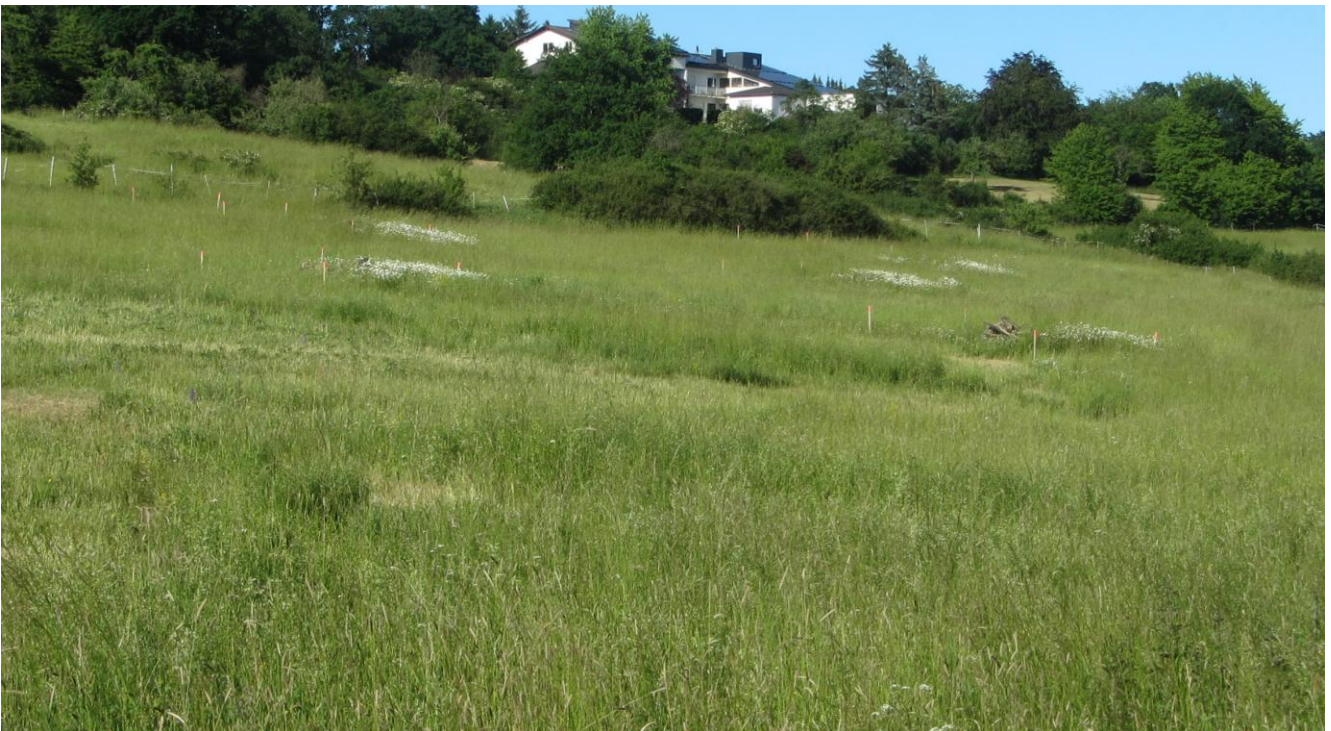
Aufnahme am 28.5.2026

Die Mahd einzelner Flächen im Vordergrund dienten der Bekämpfung von sich ausbreitenden Lupinen. Die eingebrachten, künstlichen Strukturen befinden sich dort, wo die weißen Blüten zu sehen sind (auch mit Begrenzungsstäben markiert)