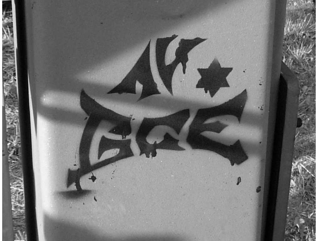
Foto: Hier steht nach Meinung der Polizei und Richter Gotthardt eine Abkürzung für „Kreative Antirepressionstage“.

Vermerke der Polizei im weiteren Verlauf durch POK Peusch (oben, Bl. 71) und Staatsschützerin Cofsky (unten, Bl. 72).